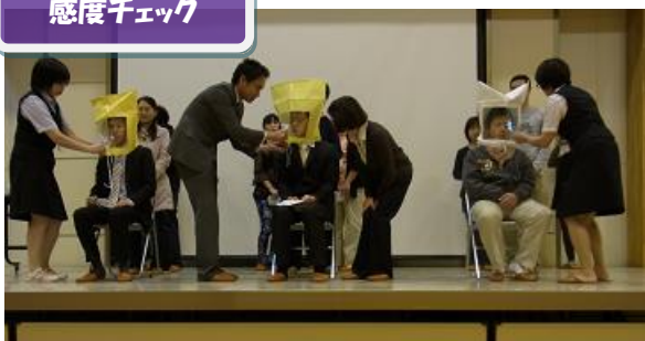
「最初はマスクを装着せず、感度チェック」 （被験者が「甘味」を感じるをテスト）