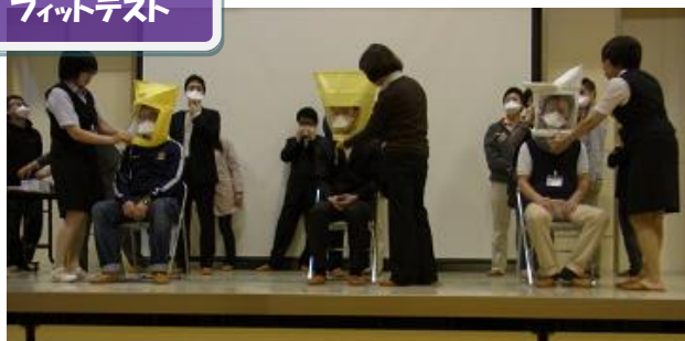
「マスクを装着し、フィットテストの実施」 （マスクが確実に装着されていれば、甘味成分が口の中に入らないため「甘味」を感じない・・・）