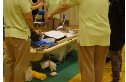
(訪問入浴のブースから)