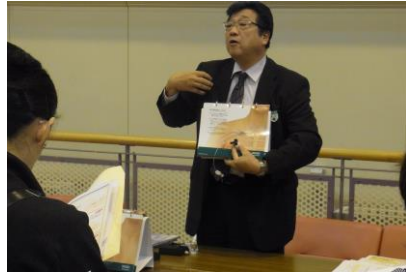
(CVポートのブースから)