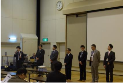
(御協力頂いた各社のご紹介)