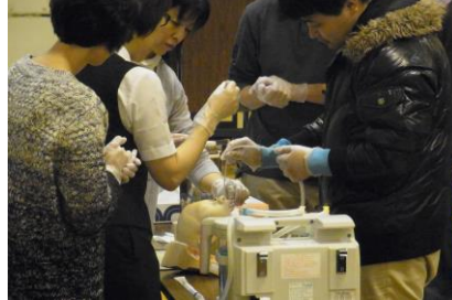
(喀痰吸引のブースから)