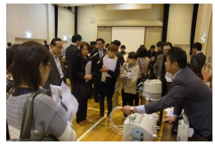
(在宅酸素のブースから)