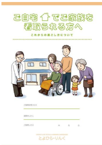
「看取りに関するリーフレット」 (療養支援からご覧頂けます)

ホームページ： http://www.toyohiralink.jp/ に各種情報を掲載しております。ご覧ください。