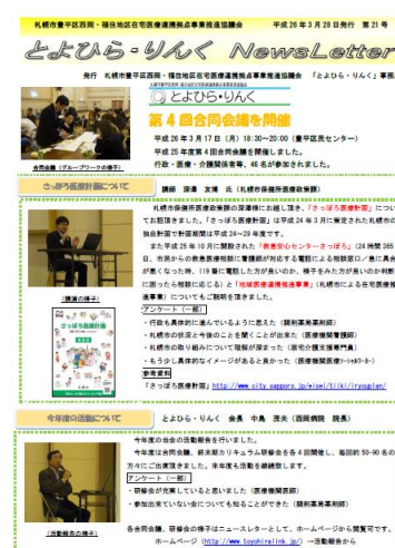
「News Letter」(全 22 号) (活動報告からご覧頂けます)

とよひら・りんく事務局 西岡病院 地域連携室 岡村・川村 ホームページ： http://www.toyohiralink.jp/