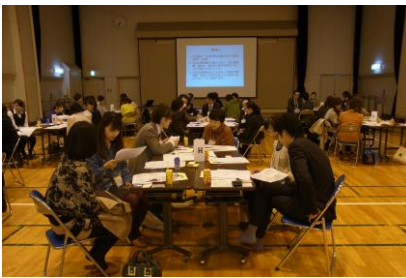
<ロールプレイの様子>

本研修会は8月に厚生労働省、国立長寿医療研究センターが2日間実施した研修会の伝達研修会です。