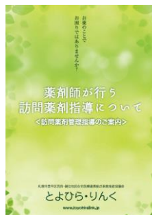
「訪問薬剤リーフレット」 (療養支援からご覧頂けます)