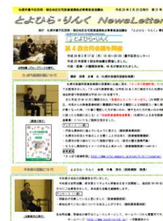
「News Letter」(全25号) (活動報告からご覧頂けます)

とよひら・りんく事務局 西岡病院 地域連携室 岡村・川村 ホームページ： http://www.toyohiralink.jp/