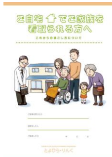
「看取りに関するリーフレット」 (療養支援からご覧頂けます)

※ホームページ： http://www.toyohiralink.jp/ に各種情報を掲載しております。ご覧ください。