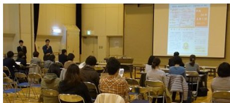
第 4 回合同会議の様子

発行 札幌市豊平区西岡・福住地区在宅医療連携拠点事業推進協議会 「とよひら・りんく」事務局