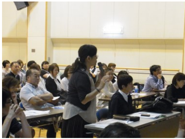
第 2 回合同会議の様子

発行 札幌市豊平区西岡・福住地区在宅医療連携拠点事業推進協議会 「とよひら・りんく」事務局