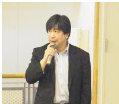
みどりの丘 福島施設長