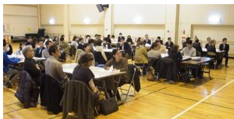
第4回合同会議の様子