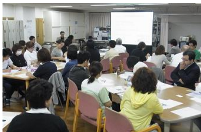
第2回合同会議の様子

発行 札幌市豊平区西岡・福住地区在宅医療連携拠点事業推進協議会 「とよひら・りんく」事務局