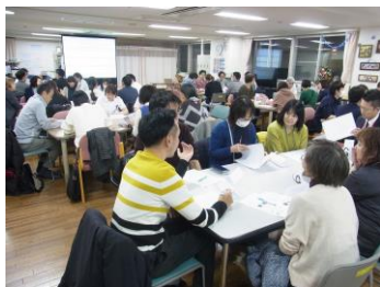
第3回合同会議の様子

発行 札幌市豊平区西岡・福住地区在宅医療連携拠点事業推進協議会 「とよひら・りんく」事務局