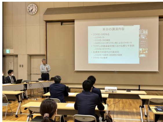
— 会場の様子 —

感染症対策で重要な事項として 「人権への配慮」 、 「医学・科学 ~ワクチンの重要性、科学(エビデンス)に根ざした対策」 、 「継続した正しい情報の発信」 、 「(めざせ)患者に優しい社会」 を あげられていました。