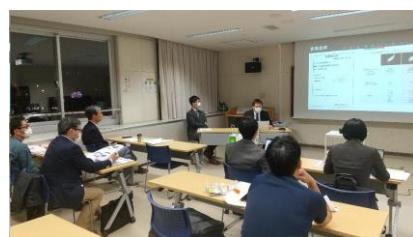
— 会場の様子 —

事前情報(食事形態・水分摂取・介助方法)、退院後の継続性(食事形態、介助方法)などの必要性を参加者で共有しました。