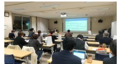
— 会場の様子 —

訪問診療医や介護施設の看護師、介護職員等からの質問もあり、ご本人の食べたいという気持ちをどのように尊重して、対応すべきかなどの難しさを共有しました。また現在、西岡病院で取り組んでいる「N-EAT」(下図)の紹介がありました。